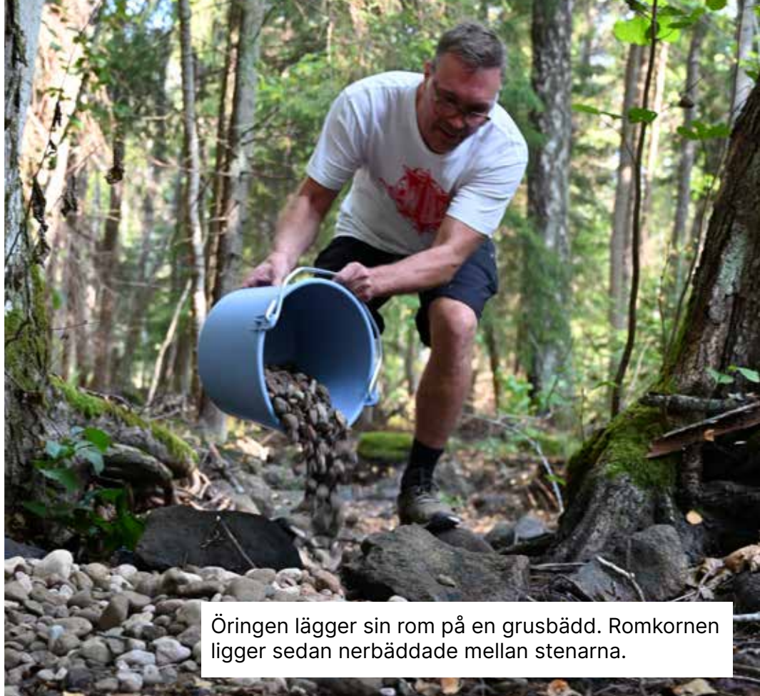
Öringen lägger sin rom på en grusbädd. Romkornen ligger sedan nerbäddade mellan stenarna.