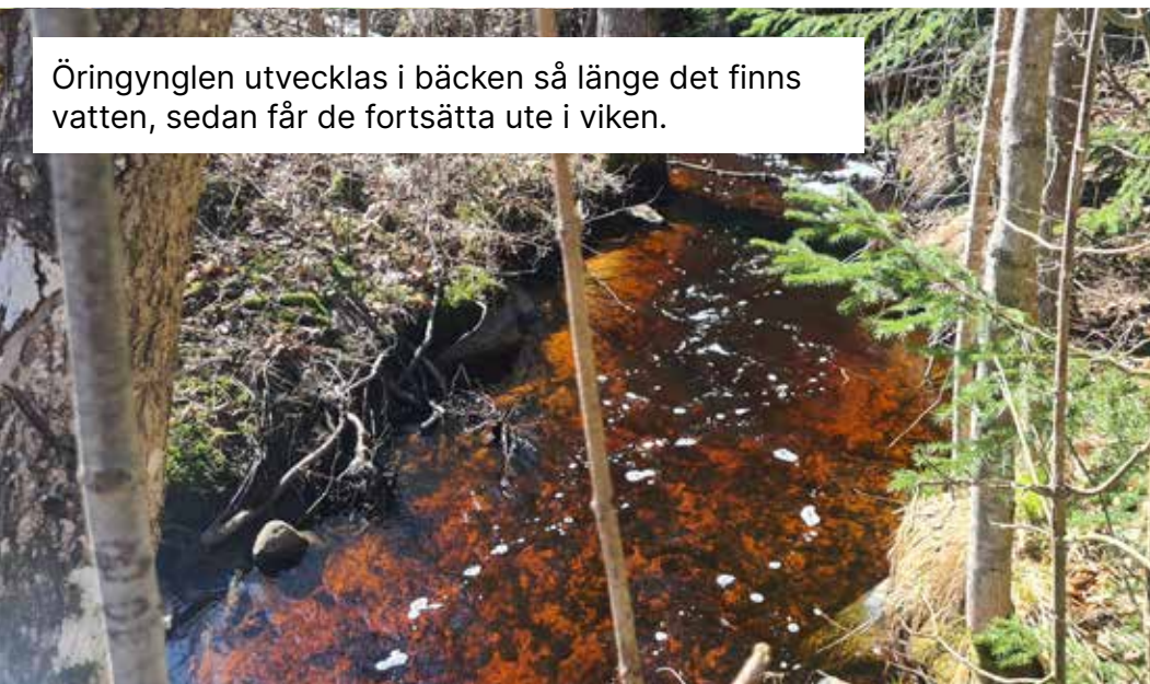
Öringynglen utvecklas i bäcken så länge det finns vatten, sedan får de fortsätta ute i viken.