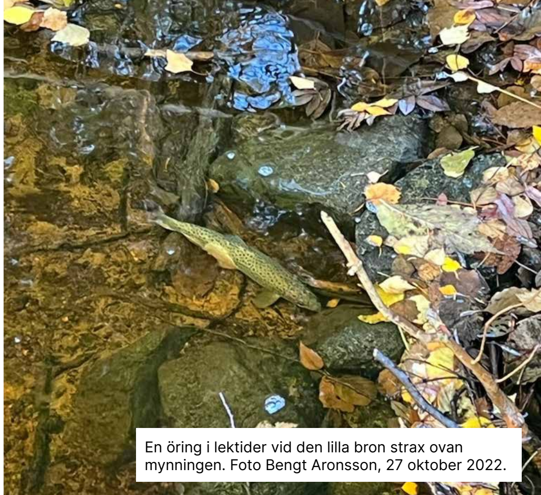
En öring i lektider vid den lilla bron strax ovan mynningen. Foto Bengt Aronsson, 27 oktober 2022.