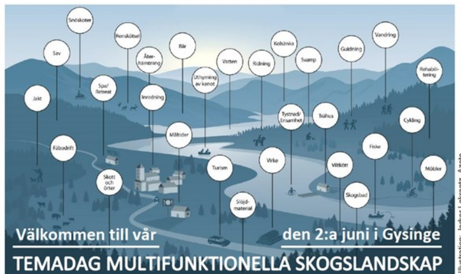
Illustration: Jerker Lokrantz, Azote

Välkommen till vår temadag om Multifunktionella skogslandskap.