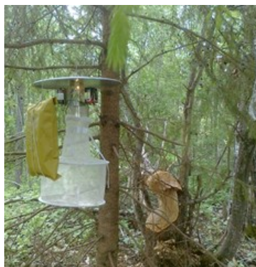
CDC-fälla med torris (frusen koldioxid).

Under juni månad kom så äntligen beskedet om att bekämpningen av översvämningssmyggor i Nedre Dalälven beviljats stöd både från