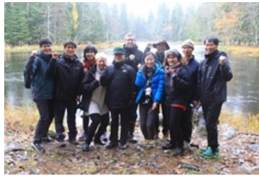
Glatt sällskap trots regn vid Sevedskvarn.

Gästerna fick en introduktion om vårt biosfärområde och exempel på två verksamhetsområden som vi har särskilt fokus på: Turism med inriktning på natur och fiske samt älvlandskapet och betydelsen av att hålla markerna öppna.