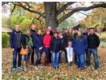
Deltagare från sju länder gästade Nedre Dalälven vid årets MAB-konferens.