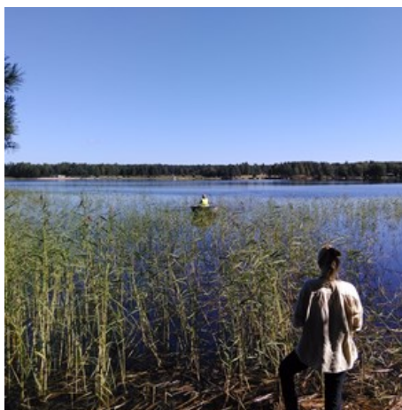
Undersökning av nytt ramområde för bekämpning vid Storån, Färnebofjärden.

Under hösten väntar avrapporteringar och tre nya medarbetare ska anställas i Biologisk Myggkontroll.